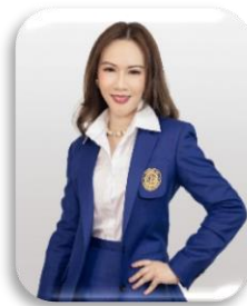
รองคณบดีฝ่ายภาพลักษณ์องค์กร