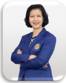
รองคณบดีฝ่ายวิจัยและวิเทศสัมพันธ์