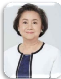
ศ.ดร.มณจันทร์ เมฆธน