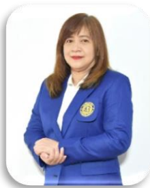
รองคณบดีฝ่ายพัฒนาองค์กร