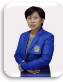
หัวหน้าศูนย์วิจัยนิวเคลียร์เทคโนโลยี