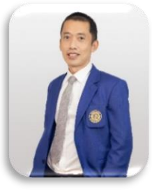
สัตววิทยา