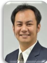
รศ.ดร.ภาคภูมิ เรือนจันทร์