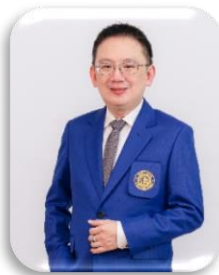
วัสดุศาสตร์