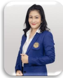
รองคณบดีฝ่ายบริการวิชาการ