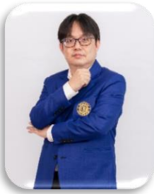
วิทยาศาสตร์พันพิภพ