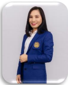
รองคณบดีฝ่ายวิชาการ