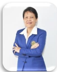
หัวหน้าสำนักงานเลขานุการ