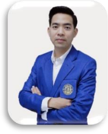
รองคณบดีฝ่ายบริการการศึกษา