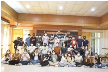
โครงการเสริมสร้างทักษะในการพัฒนา โปรแกรมครั้งที่ 9 (DevCamp 2022) ระหว่างวันที่ 21 - 25 พฤศจิกายน 2565

สามารถแก้ไขปัญหาและพัฒนาระบบดิจิทัลที่พร้อมใช้งานจริงในภาคอุตสาหกรรม ภาคบริการและภาครัฐ โดยเลือกใช้ความรู้และทักษะทาง วิชาชีพได้อย่างเหมาะสมและมีจรรยาบรรณ สามารถสื่อสารที่เกี่ยวข้องกับเทคโนโลยีดิจิทัลได้อย่างมืออาชีพ สามารถพัฒนาตนเองในการ เรียนรู้สิ่งใหม่ได้ เป็นผู้เรียนรู้ตลอดชีวิต มีความรับผิดชอบส่วนตัว วิชาชีพและสังคม สามารถทำงานเป็นทีม และสามารถประกอบการสตาร์ทอัพดิจิทัลได้