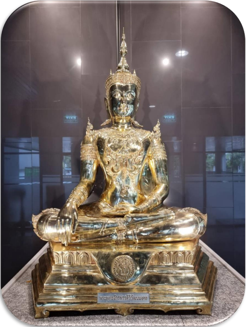
พระพุทธจักรพรรดิวิวัฒนมงคล

พระประธานประจำคณะวิทยาศาสตร์ มหาวิทยาลัยเกษตรศาสตร์ ในโอกาสครบรอบ 55 ปี คณะวิทยาศาสตร์ วันที่ 9 มีนาคม 2564 ประดิษฐาน ณ อาคารศูนย์วิจัยวิทยาศาสตร์จุฬาภรณ์ 60 พรรษา