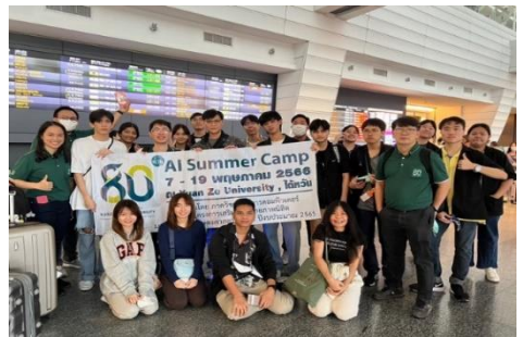
นิสิตภาควิชาวิทยากรคอมพิวเตอร์เข้าร่วมโครงการเรียนรู้ ด้านวิทยากรคอมพิวเตอร์ ในโครงการ AI Summer Camp ที่ College of Electrical and Communication Engineering, Yuan Ze University, Zhongli, Taoyuan ระหว่าง 7-10 พ.ค. 66