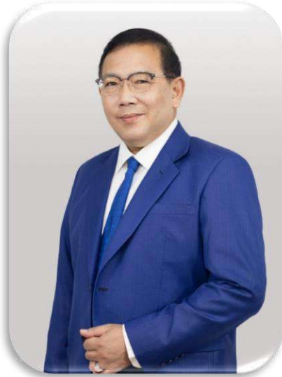
รศ.ดร.อภิสิทธิ์ ศงสะเสน