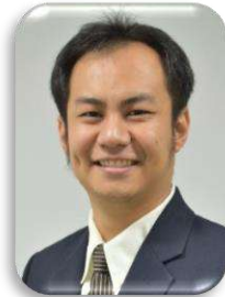
รศ.ดร.ภาคภูมิ เรือนจันทร์