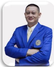
รังสีประยุกต์และไอโซโทป