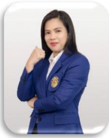
คณิตศาสตร์