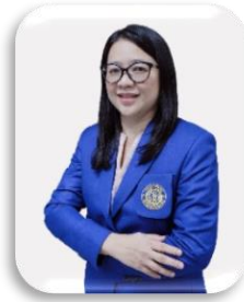
จุลชีววิทยา