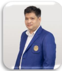
พฤกษศาสตร์