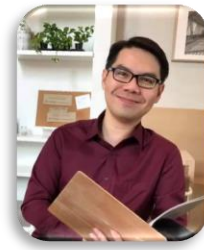
พันธุศาสตร์