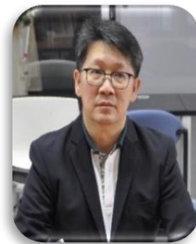
วิทยาการคอมพิวเตอร์